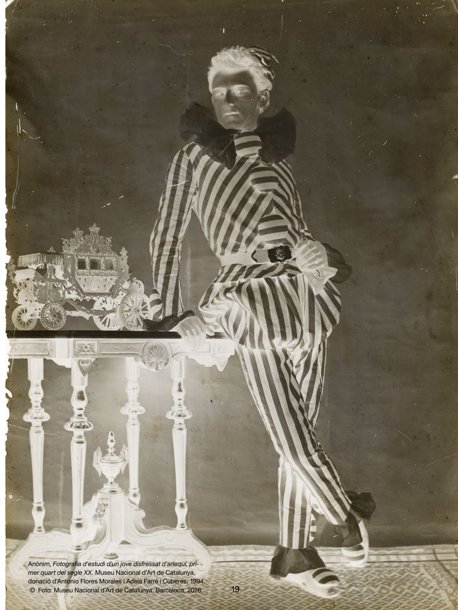
Anònim, Fotografia d'estudi d'un jove disfressat d'arlequí, primer quart del segle XX . Museu Nacional d'Art de Catalunya, donació d'Antonio Flores Morales i Adela Farré i Cuberes, 1994.

Cicle coorganitzat per la Institució de les Lletres Catalanes i el Teatre Nacional de Catalunya