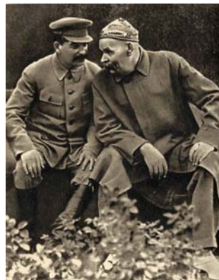
Stalin i Gorki

Si bé les relacions de Maxim Gorki amb el poder van tenir moments àlgids i moments durs, no podem dir que l'autor d' Els baixos fons patís cap mena de repressió, si més no tal com la van patir altres intel·lectuals contemporanis seus, com ara Bulgàkov o Bàbel. Tanmateix, si es consulten els arxius literaris de la KGB, la policia secreta de l'extinta Unió Soviètica, s'hi pot trobar alguna sorpresa.