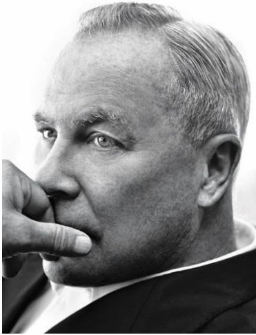
Robert Wilson

Nascut a Waco, Texas, Robert Wilson es troba entre els artistes escènics i visuals més importants del món. Els seus treballs per a l'escena no convencionals integren un ampli repertori de disciplines artístiques com la dansa, el moviment, la llum, l'escultura, la música i el text. Les seves imatges són estèticament sorprenents i tenen una gran càrrega emocional, i les seves produccions s'han guanyat l'aplaudiment del públic i de la crítica d'arreu.