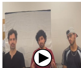
Els intèrprets de l'obra